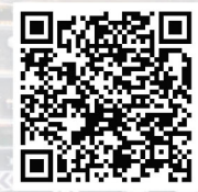
สแกน QR CODE เพื่อความใสสะอาด