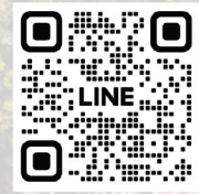
สแกน QR CODE เพื่อสอบถามข้อมูลเพิ่มเติม