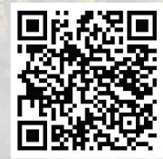
เว็บไซต์โครงการ